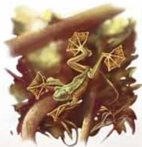
grenouille volante Rhacophorus nigropalmatus

Quel moyen extraordinaire pour se sauver d'un prédateur!