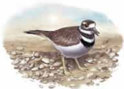
pluvier kildir Charadrius vociferus

Certains oiseaux, comme le pluvier kildir, utilisent la ruse en laissant croire qu'ils sont blessés. La stratégie est simple : lorsque la femelle aperçoit un ennemi s'approchant du nid, elle s'en éloigne en boitant, l'aile pendante, comme si cette dernière était cassée. L'ennemi la suit, tout heureux d'avoir affaire à une proie facile. Mais comme il s'apprête à la croquer, son repas s'envole subitement. Bien pris qui croyait prendre ! Le dangereux intrus est maintenant loin du nid, les petits sont hors de danger.