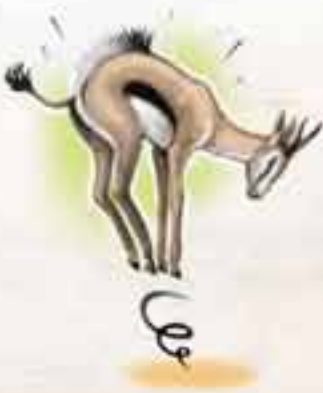
antilope springbok Antidorcas marsupialis