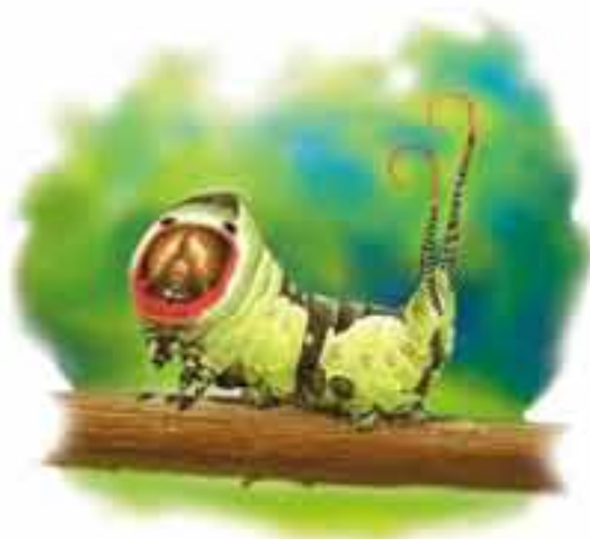
chenille de la grande queue fourchue Cerura vinula

Cette chenille verte passe généralement inaperçue au milieu des feuilles de saule dont elle se nourrit. Mais attention ! lorsqu'elle se sent menacée, la charmante petite bête se transforme en un véritable monstre : elle redresse la partie antérieure de son corps, gonfle sa face bordée de rouge et fait apparaître de faux yeux noirs. À l'extrémité de son corps, une fourche rouge imite une langue de serpent et dégage une forte odeur.