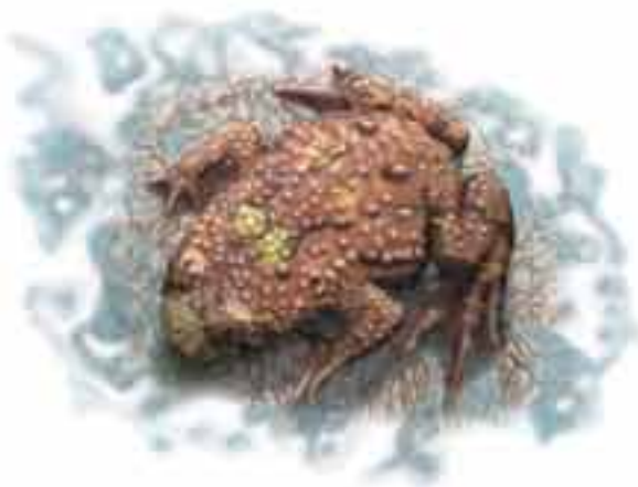
sonneur à ventre jaune Bombina variegata