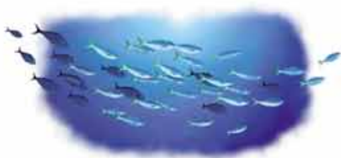
fusiliers à dos jaune et bleu Caesio teres

Lorsqu'un banc de poissons s'enfuit en zigzag, il apparaît au prédateur comme une masse grouillante qui se déplace à la vitesse de l'éclair. Difficile alors de capturer un seul individu... Les fusiliers à dos jaune et bleu sont des poissons de la grande barrière de corail d'Australie. Rassemblés en banc, ils créent une confusion de magnifiques couleurs bleue et or qui ont un effet complètement déroutant pour le prédateur.