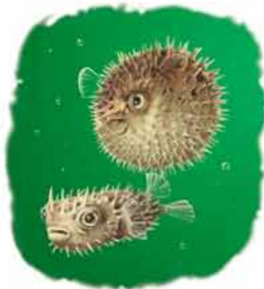
poisson porc-épic Chilomycterus antennatus

Les poissons porcs-épics habitent tout près des récifs de corail des mers tropicales. Lorsqu'ils sont dérangés, ces poissons peuvent soudainement remplir leur estomac d'eau pour devenir aussi ronds que des ballons. Des piquants qui étaient aplatis le long de leur corps se redressent, et le tout forme un repas peu appétissant. Malheur à qui s'aviserait d'avalier cette boule piquante.