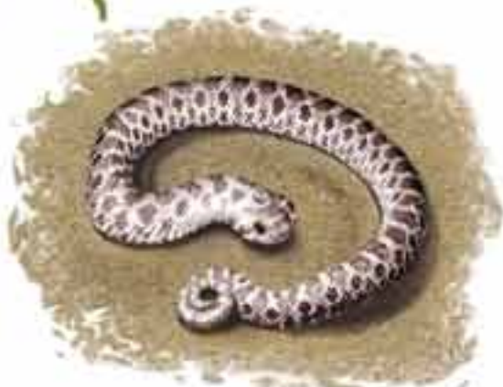
hétérodon commun de l'ouest Heterodon nasicus

Lorsqu'il est dérangé, l'hétérodon commun de l'ouest aplatit son corps et sa tête et écarte ses côtes cervicales, à la manière des dangereux cobras. Le prédateur n'est pas berné ? Voilà qu'il se gonfle d'air, souffle bruyamment, se jette au-devant de l'agresseur comme pour le mordre. Si cette comédie reste sans effet sur l'ennemi, la couleuvre fait la morte : elle se tortille, se retourne ventre en l'air, renverse la tête et ouvre la bouche. Le spectacle est saisissant !!! Qui voudrait d'une couleuvre morte pour repas ?