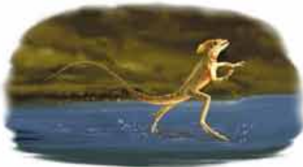
basilic à bande Basiliscus vittatus

Le basilic à bande, un iguane d'Amérique centrale, peut réaliser cet exploit grâce aux longs doigts palmés de ses pattes de derrière. Ce reptile de la famille des iguanes peut courir à une vitesse de 12 kilomètres à l'heure.